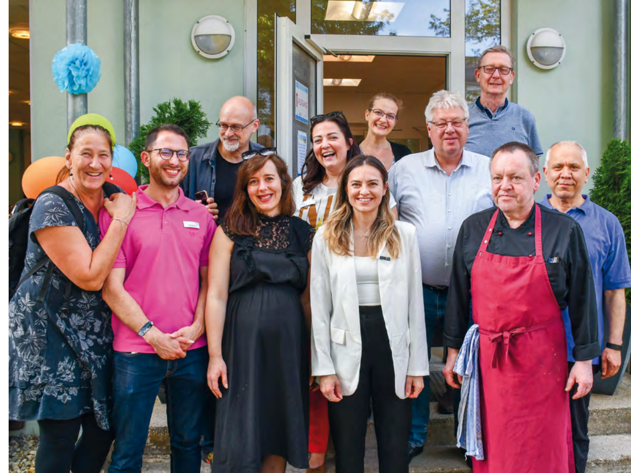
Das Team des Jugendwohnheims München-Nord zusammen mit den Vorständen des KJSW.