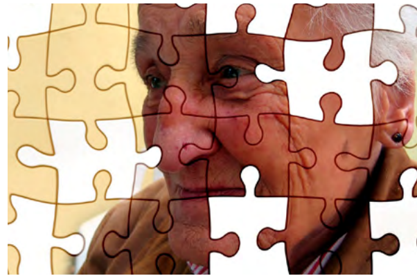
Diese alte Frau braucht zuverlässig jemanden, der sich um sie kümmert.

Jetzt haben wir es schwarz auf weiß: Die Beschäftigten wünschen eine kürzere Arbeitswoche. Das sagt der aktuelle „Arbeitszeitreport Deutschland“ der Bundesanstalt für Arbeitsschutz und Arbeitsmedizin (BAuA). Dieser aktuell erschienene Bericht liefert einen Überblick über die Arbeitszeitrealität in unserem Land in Zusammenhang mit Zufriedenheit und Gesundheit mit der Work-Life-Balance.