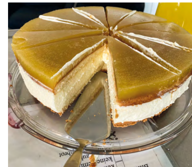
Ein Traum von einer Käsesahnetorte. Selbst gebacken mit den Eiern der eigenen Hühner.

Im Haus Maria Linden, einer Einrichtung des KJSW für Menschen mit psychischer Erkrankung sowie weiteren Beeinträchtigungen in Vaters-tetten, gibt es seit kurzem ein Café. Der Café-betrieb von und für Bewohner*innen wird gut ange-nommen. Regelmäßig bäckt eine Gruppe von Bewohner*innen gemeinsamen leckeren Kuchen und Torten. Dabei werden auch die Eier aus dem eigenen Hühnerstall eingesetzt. Besonders ange-sagt sind regelmäßig die Käsesahne-Torte und der Erdbeerkuchen. Bei Kaffee, Tee, kühlen Getränken und vor allem in netter Gesellschaft schmeckt es der HML-Community besonders gut. red.