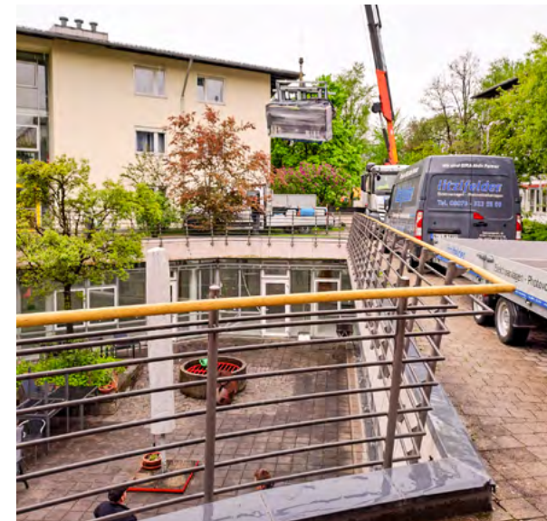
Eindrücke der Sanierung: Arbeiten im Verwaltungsbereich (rechts). Ein Lift lässt eine verpackte neue Brandschutztür hinab, die im Tiefgeschoß verbaut wird.