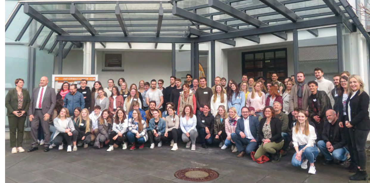
Das große Gruppenfoto zeigt alle Teilnehmenden aller vertretenen Praxisprojekte vor dem Eingang zum Campus der TH Rosenheim in Mühldorf.