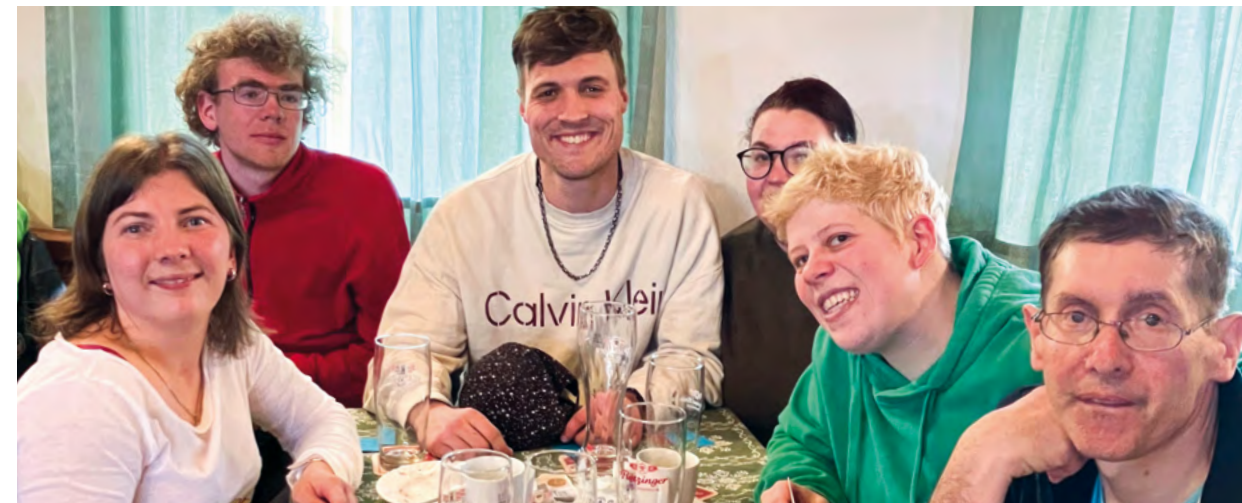
Dieses Bild zeigt einige Bewohner*innen der betreuten Wohn-gemeinschaften des KJSW in Rosenheim beim Besuch der Aufführung in Tattenhausen.

Auch die betreuten Wohngemeinschaften des KJSW Rosenheim wurden ins Theater eingeladen. Die Theater-Gemeinschaft Tattenhausen zeigte den ländlichen Schwank „Malefiz-Donnerblitz“ von Ralph Wallner in drei Akten. 45 Bewohner*innen und Kolleg*innen waren vor Ort und hatten viel Spaß bei diesem unterhaltsamen Theaterstück inklusive Freigetränk. red.