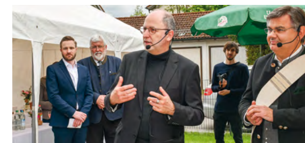
Oben rechts und unten rechts: Mitfeiernde Kolleg*innen und Ehrengäste.