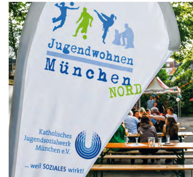
Links: Diese beiden jungen Sportler haben ihre Abi-Prüfungen absolviert und fahren zurück nach Hause. Ans Jugendwohnheim München-Nord werden sie gerne denken.