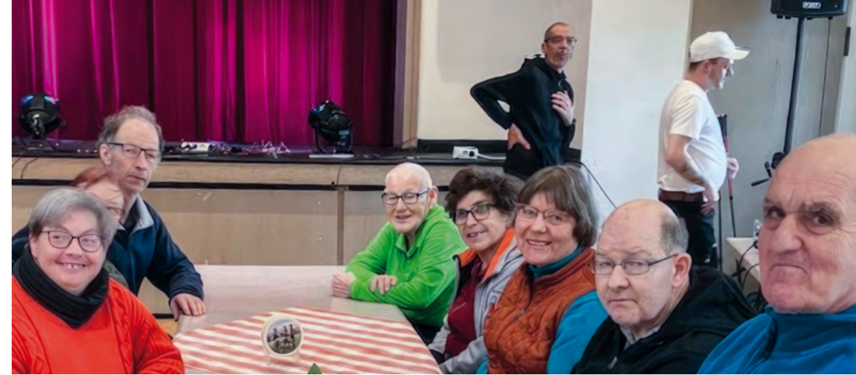
Ein Teil der Wohn-gemeinschaften des KJSW in Brannenburg genießen die Atmosphäre bei der Aufführung.

Waren die ersten Versuche am Telefon noch etwas zurückhaltend und schüchtern, so wächst seit der Videokonferenz die Spannung auf das persönliche Treffen im Juni 2023. Neben der Kommunikation werden auch Organisation und Planung geschult, denn schließlich muss auch ein Programm und die Bewirtung der Gäste gut überlegt sein. R. Heber