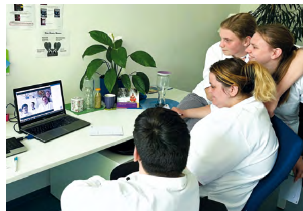
Auszubildende des 1. Lehrjahrs bei der Videokonferenz.

Eine gute Kommunikation gilt als Schlüsselqualifikation für die Integration auf dem ersten Arbeitsmarkt. Doch wie kann man diese am besten erwerben?