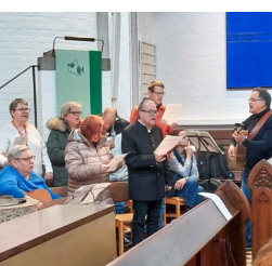
Der Chor aus dem Emmy Schuster Haus hat den Gottesdienst musikalisch gestaltet.

Menschen begegnen, die es nicht ehrlich meinen. Wir haben nicht immer eine gute Antwort. Lieber geben wir das zu und setzen so Grenzen, statt schnell etwas zu erwidern. Die Predigt sollte ermutigen, zu sich zu stehen. Im Anschluss war ein „Kirchencafé“ im Gemeindesaal, das vom Förderverein des „Katholischen Jugendsozialwerks Rosenheim e. V.“ organisiert wurde. Bei Kaffee und Kuchen gab es reichlich Austausch. Die Stadtbibliothek Rosenheim bot zudem einen Büchertisch mit Literatur in leichter Sprache an. Partner des Projekts „Leichte und Einfache Sprache“ sind das Bildungswerk Rosenheim, Landratsamt Rosenheim, Katholisches Jugendsozialwerk e.V. Rosenheim, Wendelsteinwerkstätten Rosenheim und Sägmühle INNklusiv. (D. Häfner-Becker)