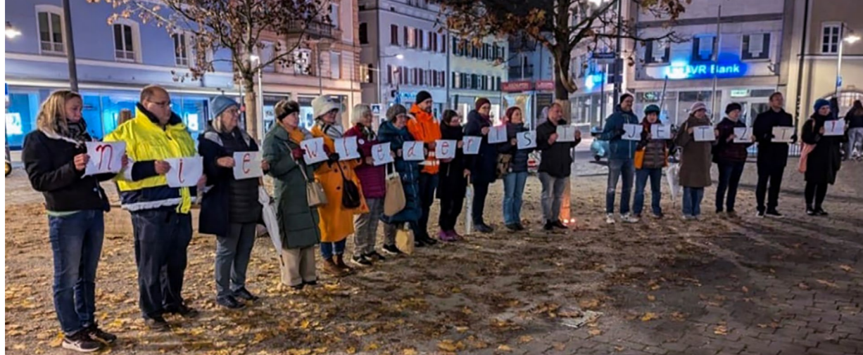
Über 70 Menschen gedachten der Ermordeten.